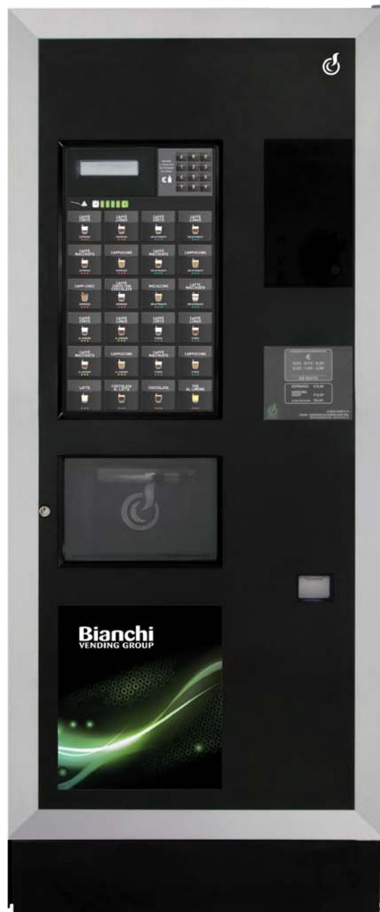
LEI500 M CLAVIER DIRECT CAPACITIF STT

LEI500 M, LE NOUVEAU CONCEPT DE DISTRIBUTEUR AUTOMATIQUE DESIGN, MODULABLE ET COMMUNICANT.