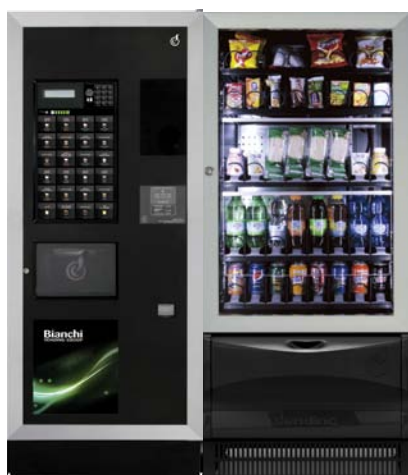
LEI 500 M CLAVIER DIRECT + VISTA M